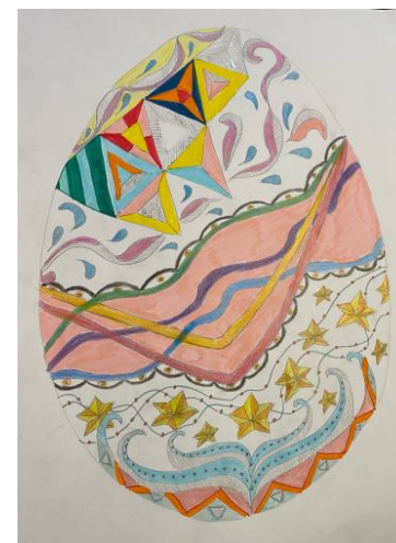
N. H. R. R.